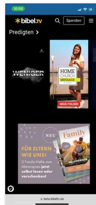
Medium Rectangle bei mobilen Endgeräten

Auf der folgenden Seite finden Sie weitere digitale Werbekanäle. Schauen Sie sich ebenfalls unsere Werbeplätze in den Newslettern an und die Möglichkeit des Branded Content in den Social-Media-Kanälen des SCM Bundes-Verlag.